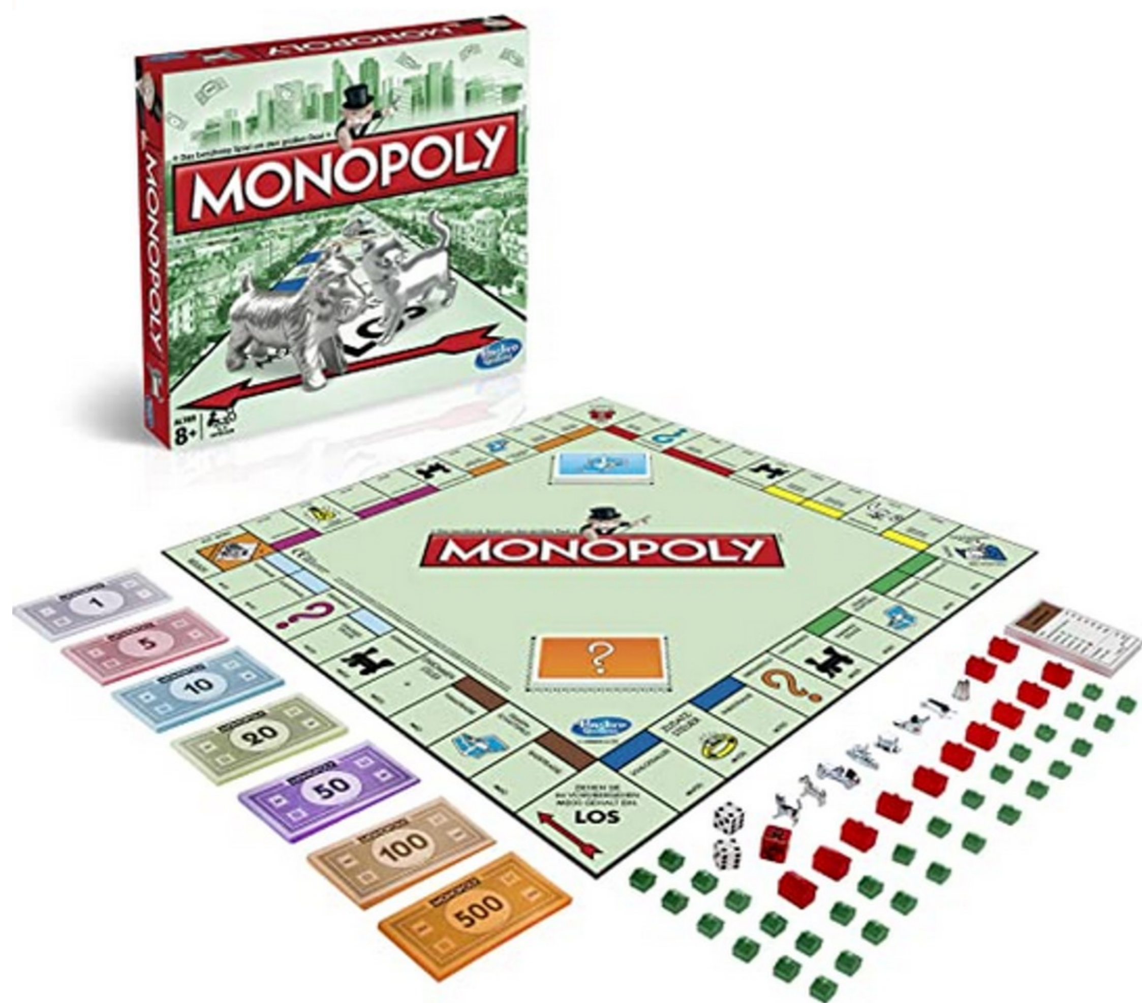
Nach dem Abendessen: Noch eine Partie Monopoly