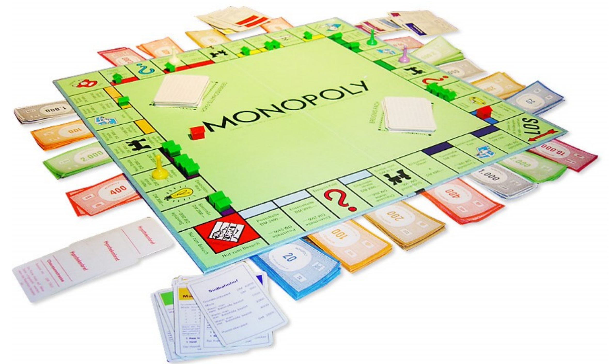
Frozen: Alles bleibt so, wie es ist!