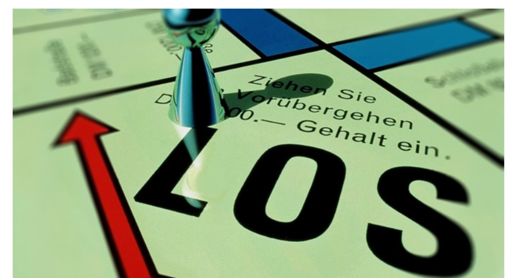
Keiner geht über Los!